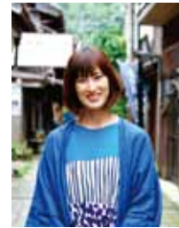
デザイナー・臨床美術士 (日本臨床美術協会認定資格)